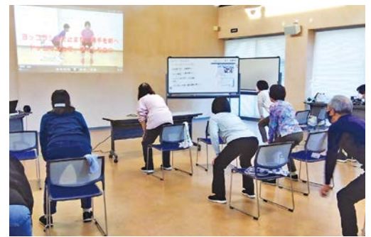
▶▶▶ とうがね健康プラン21(第3次)推進中

※この教室は、食生活改善会員の養成講座を兼ねています。市職員だけでなく食生活改善会員も講師を担当します。※とうがね健康マイレージ対象事業です。スタンプを集めて景品をもらいましょう。