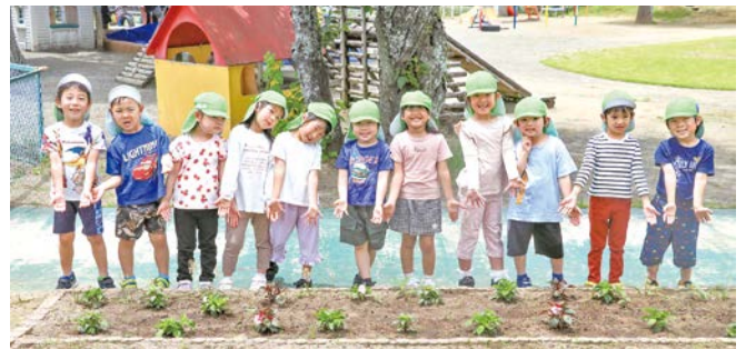
色とりどりの花でいっぱいになる日が待ち遠しいですね

深緑の葉が夏にピッタリ。暑さに負けず、秋にかけてきれいな花を咲かせてくれそうです。