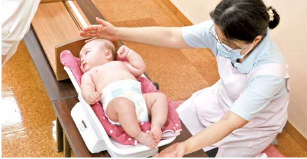
いろいろな方に見守られての子育て ひとりじゃないから、いつでも相談しに来てね

子育ては、すくすく成長する子どもをほほえましく思う一方で、発育のことなどで気がかりなこともありますよね。そんな不安を解消してくれるのが、ふれあいセンターで毎月実施しているすくすく育児相談。成長や体のこと、離乳食や歯のお手入れなどについて、保健師や管理栄養士、歯科衛生士が相談に応じています。ひとりで抱えず、専門職と話すことで、子育て中の不安軽減にもつながります。詳しくは、子育てガイド(P20)をご覧ください。