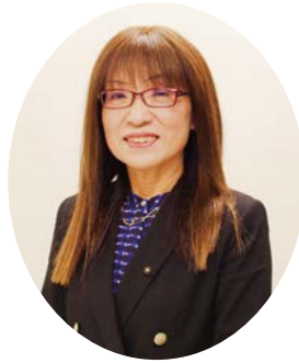
副議長 なかむら みえ 中村 美恵 60歳・自由民主党・3期目