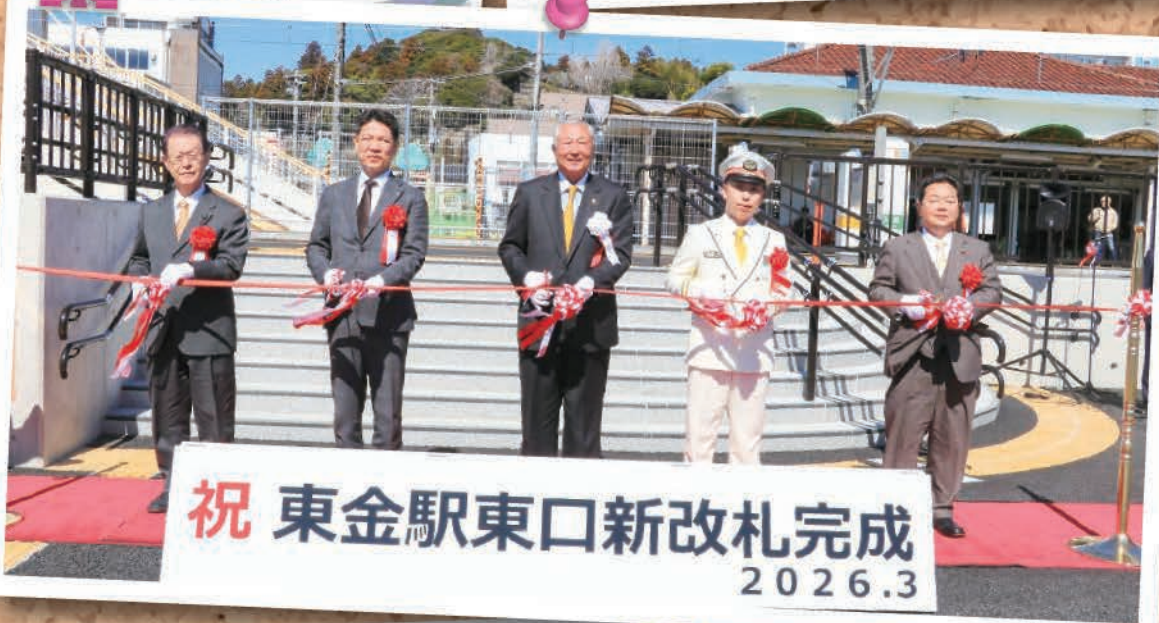
祝 東金駅東口新改札完成 2026.3