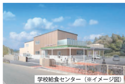
学校給食センター（※イメージ図）

小学校の給食施設の老朽化に伴い、これまでの自校方式から共同調理場となるセンター方式により小学校等に給食を提供するために、令和10年9月からの提供開始に向けて学校給食センターの建設工事費・監理業務委託料を計上しました。