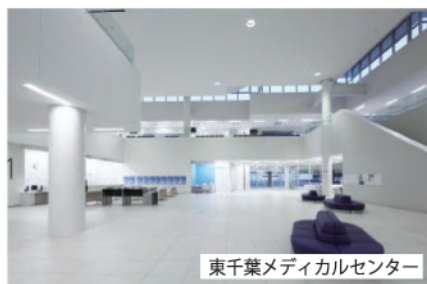
東千葉メディカルセンター

設立団体である東金市・九十九里町が地方独立行政法人東金九十九里地域医療センターに対して、業務運営に関する目標として指示した第5期中期目標に基づき、法人が作成した令和8年度から令和11年度までの4年間を計画期間とする第5期中期計画を認可するものです。