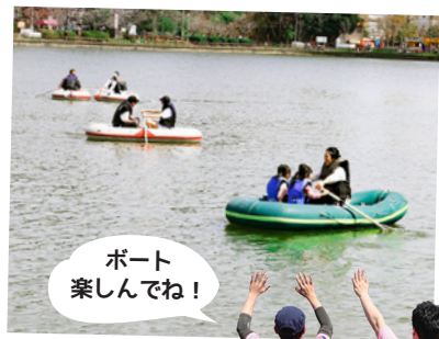
ボート楽しんでね!