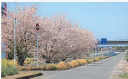
東金九十九里有料道路 押堀インターチェンジ付近