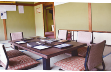
八鶴館展では旅館時代の品々が展示されていました