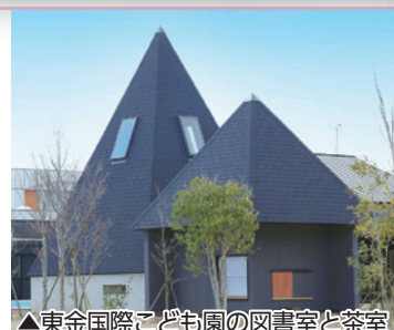
▲東金国際こども園の図書室と茶室

市では、少子化の進行や多様化する保育ニーズの高まりを踏まえ、幼保再編を進めています。人格形成の基礎を培う重要な時期である就学前の子どもが「心豊かにたくましく、未来を生きる力」を育めるよう、また、保護者の「仕事と家庭の両立」を支援するため、引き続き幼児教育・保育の充実に取り組んでいきます。