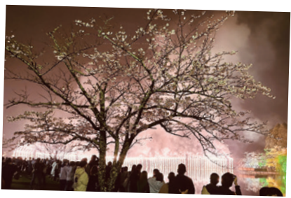
雨間の花火大会。ナイアガラも圧巻!