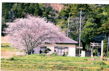
巖島神社(大豆谷)付近