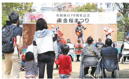
ステージイベントも大盛況