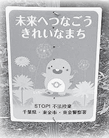
▲不法投棄防止看板

◆不法投棄を発見したら 道路などで不法投棄を発見した場合、不法投棄の発生日時や発見日時、場所、投棄されたものの情報提供をお願いします。東金市LINE公式アカウントからも不法投棄の通報ができます。 ※個人の所有地に不法投棄された場合、投棄者が判明しなければ、その土地の所有者または管理者が投棄物の撤去を行うこととなります。 問い合わせ▼環境保全課 ☎(50)1171