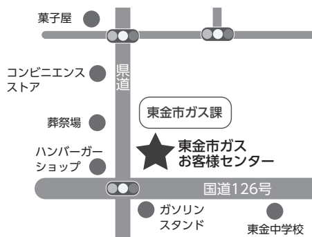
▲東金市ガスお客様センター周辺地図

ガス料金徴収包括業務の受託者は、シーデーシー情報システム(株)からCDCアクアサービス(株)に変わります。なお、この変更によるお客様の手続きはありません。