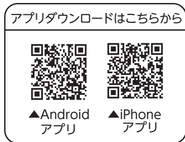
アプリダウンロードはこちらから