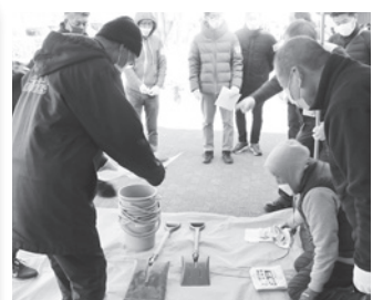
必要な資材を受け渡し

訓練は社会福祉協議会が開催。災害ボランティアセンターのあり方や「自助・共助・公助」の考え方の講義からスタートしました。災害発生時は、公助でできることは限られ、自助・共助の考え方が重要です。立上げ訓練では、実際に災害が発生した際にスムーズに対応ができるよう、実技を通して活動時の心得を学びました。東金市の受援力の向上につながる1日でした。