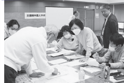
支援に必要な情報をまとめてみよう