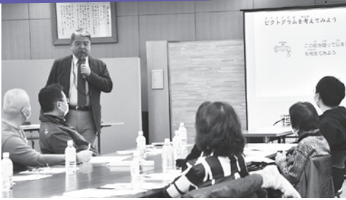
外国人に情報を伝えるには?