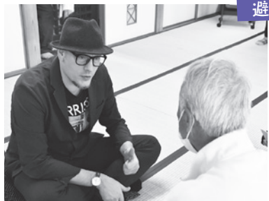
何か困っていることはありますか?