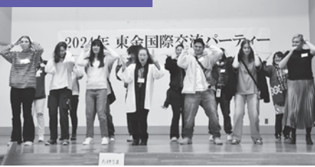
2024年 東金国際交流パーティー