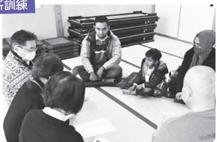
学校がどうなるのか調べてほしいです