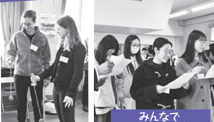
みんなで日本の名曲を合唱