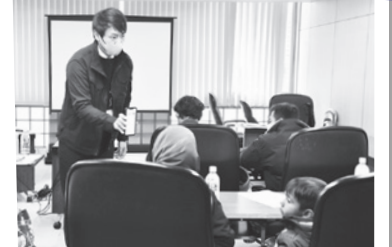
スマホアプリで市内の避難所を多言語で確認できます