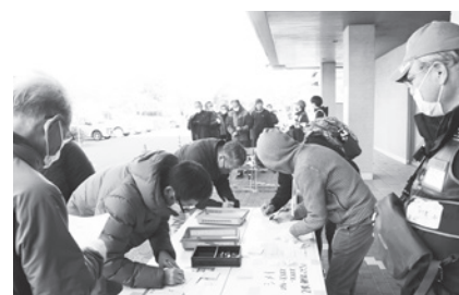
受付。安全な活動のために必要です