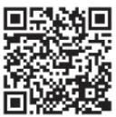
▲市ホームページ災害に関する募金について