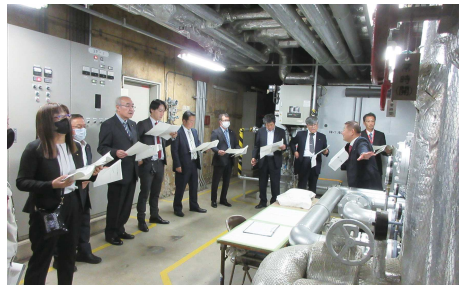
現地視察(東金文化会館冷却水ポンプ更新工事)