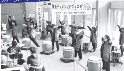
心を揺さぶられる演奏に大きな拍手!