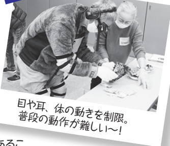
目や耳、体の動きを制限。普段の動作が難しい〜!

「チャレンジド」は「挑戦という課題やチャンスを与えられた人」という、障がい者を意味する言葉です。障がいがあることで体験したものを、自分自身や社会のために生かしていこう、という思いが込められています。