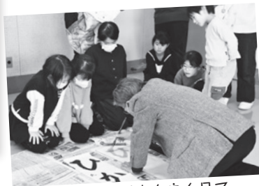
先生のお手本を良く見て