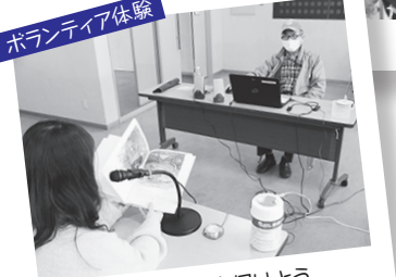
"声"で情報を届けよう。うまく録音できましたか?