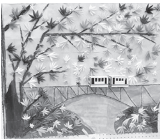
鮮やかなペーパークラフトの紅葉