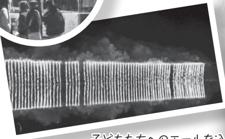
子どもたちへのエールを込めたプレゼント