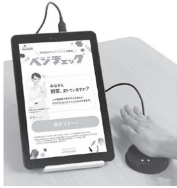
▲ベジチェックでの測定

健康づくりに役立つ展示や野菜350gの計量体験を通じて生活習慣病の予防について学べます。1日の推定野菜摂取量を測定するベジチェックの体験も予定しています。 とき▶展示=2月1日(木)~29日(休)午前9時~午後6時/体験=2月23日(金)・24日(土)午前10時~午後2時 ところ▶道の駅みのりの郷東金 問い合わせ▶東金市食生活改善会 (健康増進課) ☎(50)1174