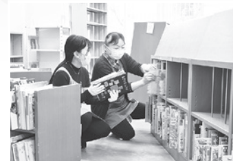
再開に向け、何万冊もの本を書棚へ丁寧に戻しました