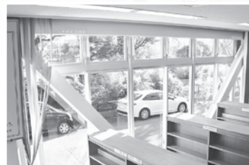
斜めの鋼材や耐震壁を設置し、耐震性を強化しました

長期間の休館により皆さんにご不便をおかけしましたが、工事を経て、より安全・安心に利用できる施設になりました。