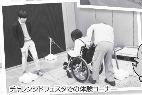
チャレンジドフェスタでの体験コーナー