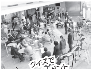
クイズで景品プレゼント

問い合わせ▶市社会福祉協議会 ☎(52)5198 FAX(52)8227 mailto:togane.shakyo@cronos.ocn.ne.jp