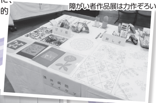
障がい者作品展は力作ぞろい