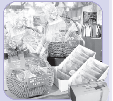
▲米粉を使ったお菓子

道の駅みのりの郷東金では、東金産の米粉を使用したケーキや焼き菓子のギフトセットを販売しています。可愛いバスケットでのセットやギフトボックスをご用意しています。ケーキは東金メロン、東金いちご、東金柚子の3つのフレーバーがあります。プレゼントにぜひ!