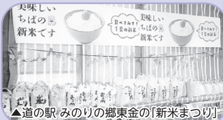
▲道の駅 みのりの郷東金の「新米まつり」