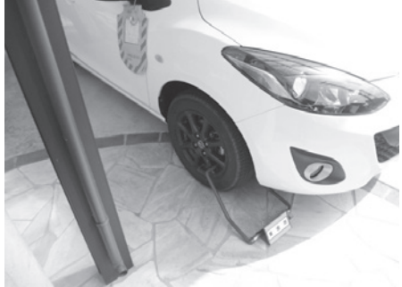
▶自動車差し押さえた様子