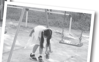
どうしてここに捨てるのかな…