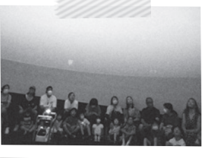
この日の東金の夜空を解説