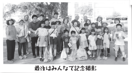
最後はみんなて記念撮影

子どもが遊び、皆の憩いの場でもある公園。きれいに保てるよう、一人ひとりが気を付けたいですね。