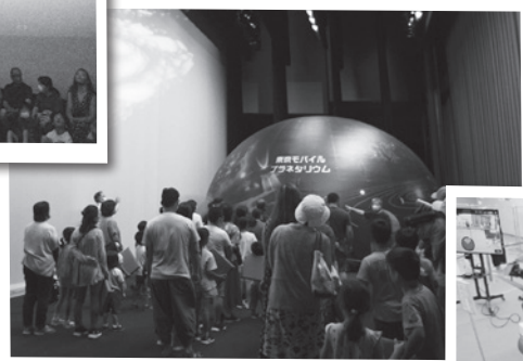
エアドームのプラネタリウム登場