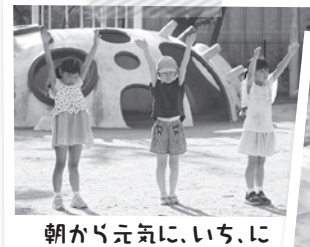
朝から元気に、いち、に

ラジオ体操最終日である8月25日(金)にも清掃活動を行う予定です。参加してみたいいかがですか。