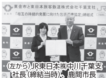
(左から)JR東日本(株)中川千葉支社長(締結当時)、鹿間市長

この協定により、市とJRは、互いに連携を深め、駅を中心としたまちづくり、公共交通の利便性・安全性・持続可能性の向上、地域資源を活用した地方創生に力を合わせて取り組んでいきます。