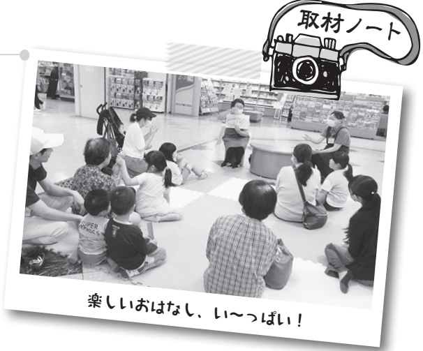
取材ノート 楽しいおはなし、いっしょに!

みんな来てね! 今後も毎週土曜日の午後3時からサンピア2階(旅行サロン前)で行います。対象は幼児~小学校低学年です。