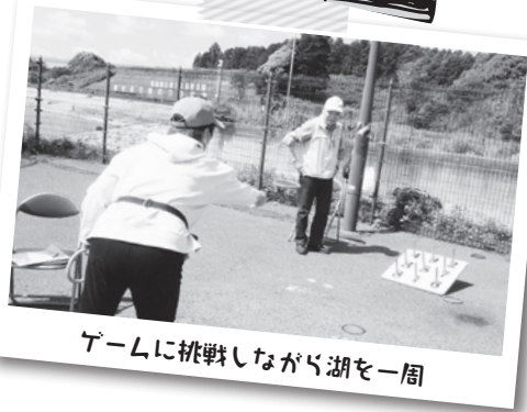
ゲームに挑戦しながら湖を一周

ヘルスサポーターの会による、ときがね湖ふれあいウォーキング開催。歩きながら、東金市ロコモ体操、脳トレ、輪投げ、クイズなどに挑戦し、楽しく健康への意識を高めました。