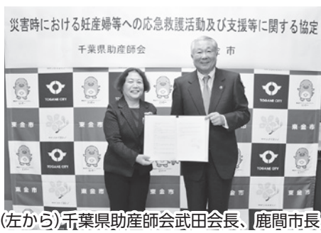
(左から)千葉県助産師会武田会長、鹿間市長

災害時においても妊産婦や乳幼児が安心して生活できるよう、きめ細かに対応する助産師活動が、災害時の大きな支えになるものと期待しています。