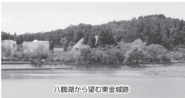
八鶴湖から望む東金城跡