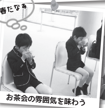
お茶会の雰囲気を味わう