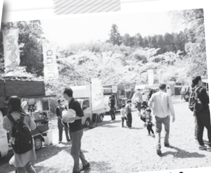
バラエティ豊かなキッチンカー集合