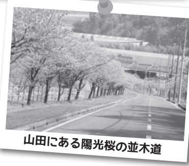
山田にある陽光桜の並木道