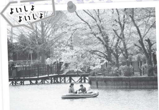
ボートに乗って、いつもとは違う景色を

東金桜まつりが4年ぶりに開催。多くの花見客が会場を訪れ、桜やイベントを楽しみながら春の訪れを感じていました。