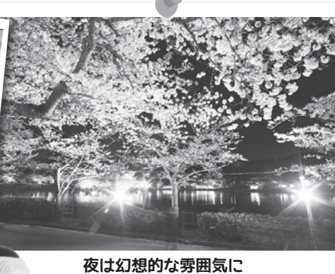
夜は幻想的な雰囲気に