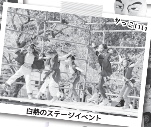
白熱のステージイベント