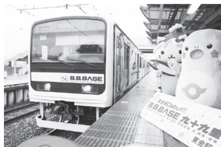
▲東金駅で、千葉県森林組合制作の木製コースターと、東金福祉作業所制作の缶バッジを配っておもてなし

B・B・BASE 九十九里デビュー 3月25日・26日に、両国駅発のサイクルトレインB・B・BASE九十九里が、東金線で初めて運行しました。当日は、とっちーとくくりんも東金駅でおもてなし。あいにくの雨でしたが、東金駅で自転車と降りる方、車両を一目見ようと集まった方などで、東金駅はにぎわいました。