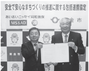
▲あいおいニッセイ同和損害保険株式会社千葉支店長(写真左)と鹿間市長

安全で安心なまちづくりの推進に関する包括連携協定 3月22日(日)に、あいおいニッセイ同和損害保険株式会社と「安全で安心なまちづくりの推進に関する包括連携協定」を締結しました。 この協定の締結により、同社が持つ損害保険業務で蓄積したノウハウを各種イベントで活用することや、豪雨などの水害が発生した際に火災保険契約者への「罹災証明書申請に関するサポート」など、「安全で安心なまち」の実現のために協力いただけることになりました。