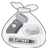
セロハンテープで絶縁処理してください。

【注意】 ・発火防止のため乾電池やコイン電池、ボタン電池は、セロハンテープで絶縁処理してください。 ・電池が原因の発火事故が全国的に増加しています。絶対に他のごみと一緒にしないでください。