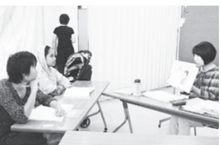
日本語に不慣れで困っている方が周りにいたら紹介してください

日本語に不慣れで、日常のコミュニケーションに困っている在留外国人のために、ボランティアで日本語を教えています。日本語を習いたい方は、気軽にお問い合わせください。