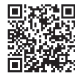
学生納付特例制度のページ