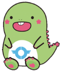
東金市マスコットキャラクター