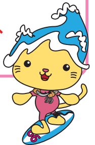
九十九里町イメージキャラクター