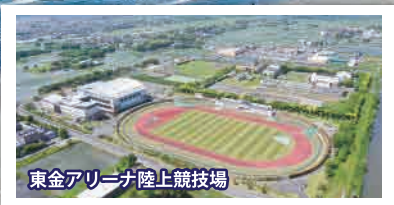
東金アリーナ陸上競技場