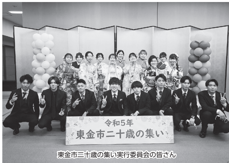
東金市三十歳の集い実行委員会の皆さん

1月8日に東金文化会館にて東金市二十歳の集いが開催されました。同級生との再会を楽しんでいる光景が印象的でした。二十歳を迎えた皆さん、おめでとうございます。