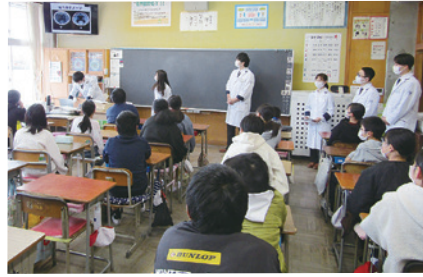
一人ひとりがしっかり学びました

東小学校で、6年生を対象に、城西国際大学薬学部学生による薬物乱用防止教室が開かれました。学生たちのロールプレイを交えた講義を通じて、薬物や酒、たばこなどが身体に与える影響を学びました。