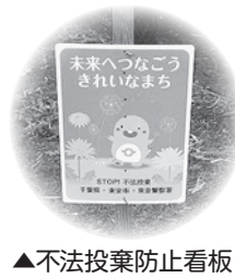
▲不法投棄防止看板

また、不法投棄対策の一つとして、不法投棄防止看板を配布中です。ご希望の方は、連絡の上、環境保全課窓口へお越しください。