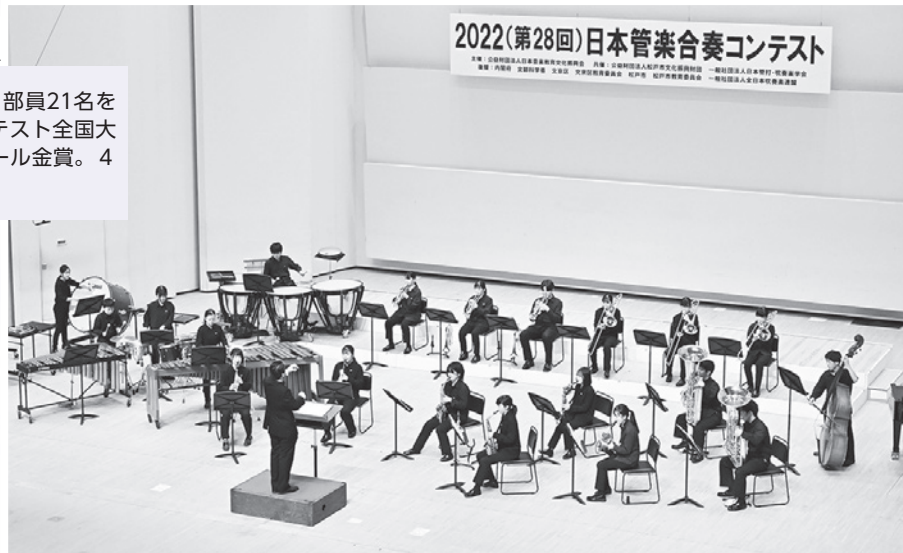
2022(第28回)日本管楽合奏コンテスト

部活では、「諦めないでやり通す」ことを皆で心掛けてきました。ひとつひとつのフレーズを大事に、最高の音を届けたいです。