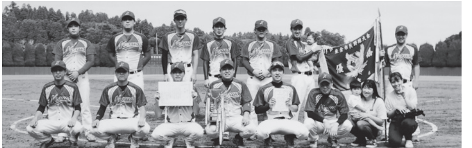
優勝チームのNEXUSの皆さん