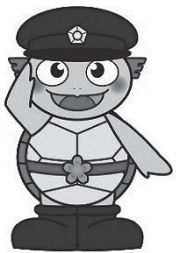
とうがねくん 東金警察署管内 安全・安心キャラクター