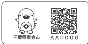
大きさ▶縦2.5cm、横5cm程度 配布枚数▶1人につき、洗えるラベル30枚、蓄光シール10枚

持ち物▼介護保険証、その他認知症の疾患の分かる書類(お持ちの方) 申込方法 ▼申請書に必要事項を記入し、左記まで申し込み ※書類は窓口で配布するほかホームページからダウンロードできます。 申込・問い合わせ ▼高齢者支援課 ☎(50)1165