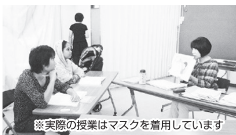
※実際の授業はマスクを着用しています

日本語に不慣れで、日常のコミュニケーションに困っている在留外国人のために、東金I・V・C日本語教室ではボランティアで週3回、日本語を教えます。 日本語を習いたい外国人の方は、気軽にお問い合わせください。 また、日本語に困りの外国人の方が周りにいる方は、この教室を教えあげてください。 とき▶次の3クラス ①木曜日クラス 午前10時~正午 ②金曜日クラス 午後7時~9時 ③土曜日クラス 午前10時~正午 ところ▶中央公民館