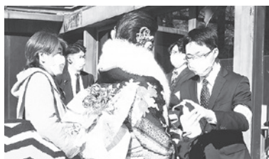
▲入場時は検温とアルコール消毒をしました

医療保険者から交付を受けた医療費通知など(健康保険組合などが発行する「医療費のお知らせ」など)を添付すると明細部分の記入を省略できます。