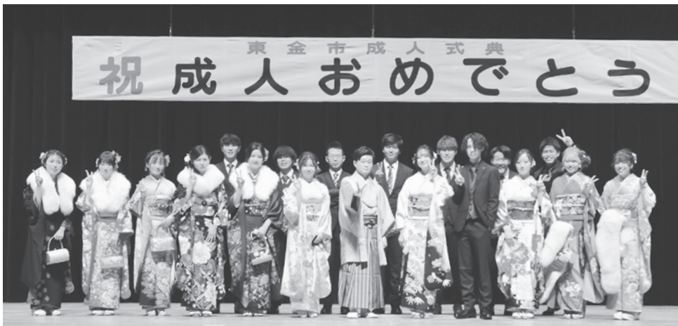
▲東金市成人式実行委員会の皆さん。※撮影のため一時的にマスクを外しています。

1月9日に東金文化会館にて成人式が開催されました。同級生との再会を楽しんでいる光景が印象的でした。大人へ仲間入りされた皆さん、成人おめでとうございます。