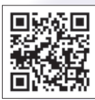
▲市ホームページ「障がい者作品展」

今年の障がい者作品展は、新型コロナウイルスの感染拡大防止のため、市ホームページでオンライン開催します。障がいのある方による工作や絵画などをたくさん掲載しますので、ぜひご覧ください。とき▼12月3日(金)～9日(木)