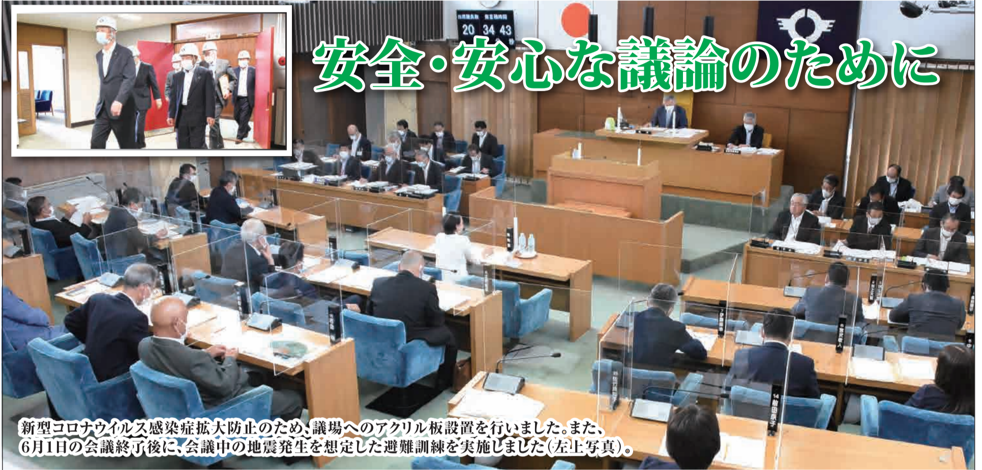
新型コロナウイルス感染症拡大防止のため、議場へのアクリル板設置を行いました。また、6月1日の会議終了後に、会議中の地震発生を想定した避難訓練を実施しました(左上写真)。