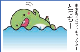
東金市マスコットキャラクター とちー