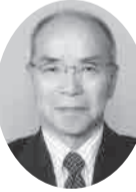
社会民主党 水口剛

問 いわゆる「コンビニ受診」といわれるような緊急性の低い受診を減らし、重症患者に対し適正な救急医療を確保していくためには、医療相談窓口の整備が重要であると考えている。本市における医療相談窓口の状況について伺う。