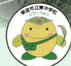
マスコットキャラクター ひがっちゃん

校歌 一、平野をわたる 風さやか 自然の恵み 地にあふれ ともに気迫を 誓い合い 深き英知を 磨き合う ああ東中 我らの誇り ああ東中 我らの誇り 二、太平洋の夕騒に 豊かに明ける 我が郷土 若き翼を うち連ね 天かける日の 夢たかし ああ東中 我らの母校 ああ東中 我らの母校 作詞 石原 昇 補作 鈴木 八郎 作曲 山崎 八郎