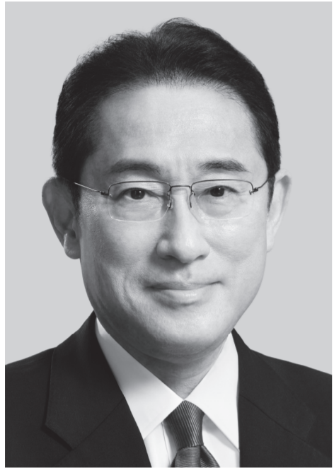
自民党総裁 岸田文雄