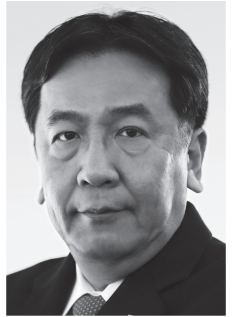
立憲民主党 代表 枝野幸男