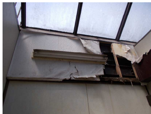
屋根からの雨漏りの影響により、トイレの壁が破損しております