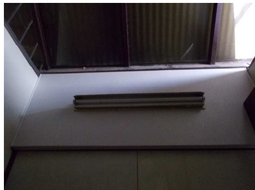
トイレの壁を張り替えてきれいになりました