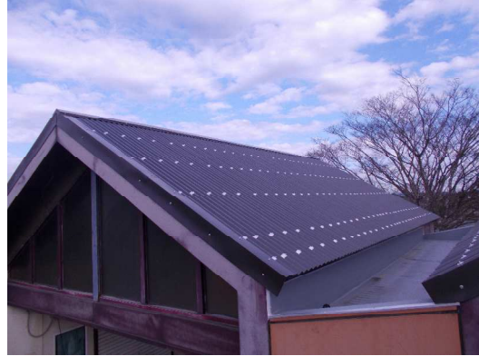
修繕後の屋根の状況