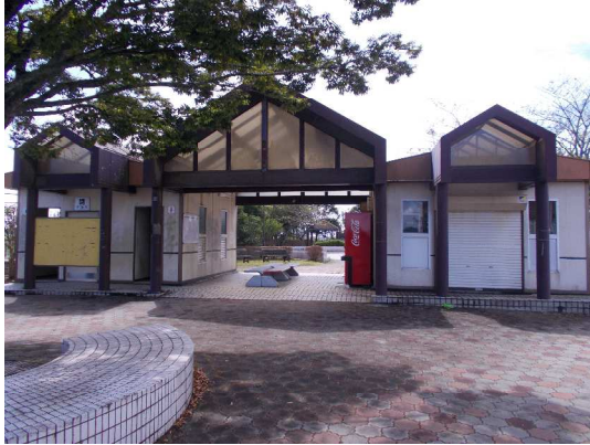
トイレ修繕前の状況

平成3～4年（1991～1992年）に求名駅前広場の整備に伴い、求名第2公園にトイレを設置いたしました。トイレの屋根は経年劣化により、部分的に雨漏りが発生し、今回「みどりのふるさと基金」を活用して、トイレ修繕をおこないました。