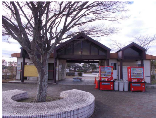
トイレ修繕後の状況