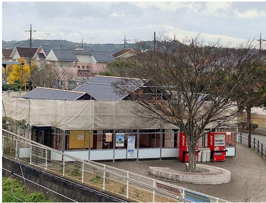
トイレ修繕時の施工状況