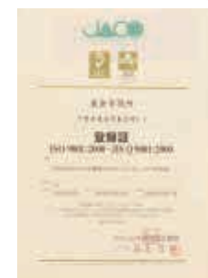
ISO9001認証(平成15年) ISO 9001 certification 品質に関する国際規格。組織を効率良く効果的に動かすためのシステムです。

東金市では、新しい時代にふさわしい市役所の経営管理を行うため、二つのISO認証を取得しました。これは、実際に何をやるか宣言し、きちんと実行されているかを内外から評価、改善を続けていくシステムです。 ISO14001は、仕事をするとき環境に配慮して、地球にやさしい取り組みをするというものです。具体的には、電気・ガスの省エネや事務用紙の節約などにとり、ケナフの栽培や環境イベント(アースセレブレーション)の開催など、環境にやさしい活動