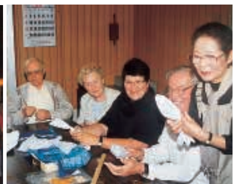
さまざまな東金市の国際交流 Various international exchanges in Togane 左：毎年「やっさまつり」に参加している韓国・安山市の青少年交流団。 右上：来日したリュエイユ・マルメゾン市民との文化交流のひとつ。