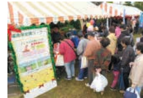
上：アースセレブレーション Earth celebration 地球環境をテーマに、子どもたちにも親しみやすいイベントを定期的で開催しています。