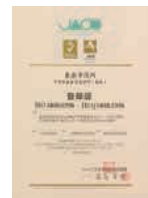
ISO14001認証(平成12年) ISO 14001 certification 環境に関する国際規格。事業所などの活動を、地球の環境保全につなげるシステムです。

A city with friendship ties to the world With the establishment of a sister city relationship with Rueil-Malmaison, France, the dispatching of youth volunteers overseas, and other such activities, the city of Togane is engaging in robust exchanges with the international community. Residents are sharing the daily life, education, and culture with people from other countries to promote greater understanding of one another. At the same time, as a member of the international community, we are nurturing a spirit that seeks world