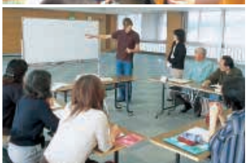
上：リュエイユ・マルメゾン市での交流会 A get-together with citizens of Rueil-Malmaison, France 伝統文化や芸術を紹介し合うなど、実りある交流が続いています。 中：青少年ボランティア海外派遣 Dispatching youth volunteers overseas ホームステイや交流学習を通じてアジアの文化や生活を体験しています。 下：英会話教室 English conversation class 地域在住の外国人英語講師による英会話教室を開催しています。