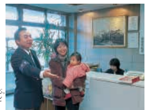
フロアマネージャー Floor manager 市役所玄関での誠実な対応。市民に対する行政サービスの質を高めます。

Building a new framework for a new era In 2000, the Togane City Hall received certification for ISO 14001 for environmental management; in 2003, it was certified for ISO 9001 quality management. Togane is the first of Japan's 682 cities to be fully certified for both of these ISO standards.