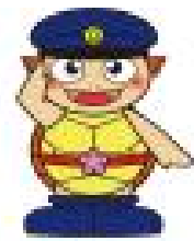
東金警察署内 安全・安心キャラクター