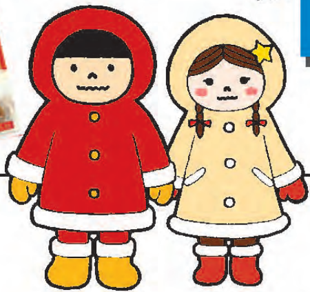
北海道陸別町しばれくんとつららちゃん

ジビエ肉のジャーキーや「陸別しばれ和牛」も登場！人気の「しばれ君まんじゅう」も来るよ！