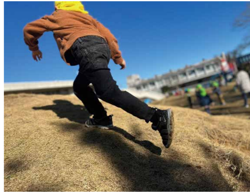
小高い山も何のその、駆け抜けます