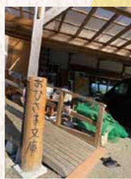
おひさま文庫 東金市東中島 297 080-7556-0311