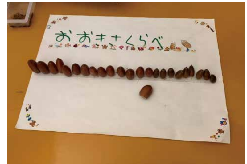
どんぐりのせいくらべ