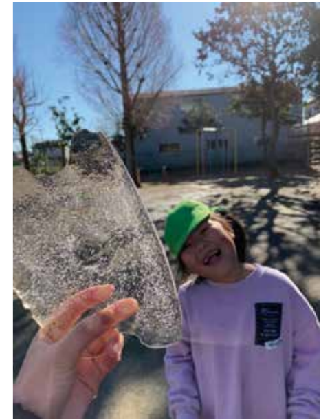
この先に何が見えるかな