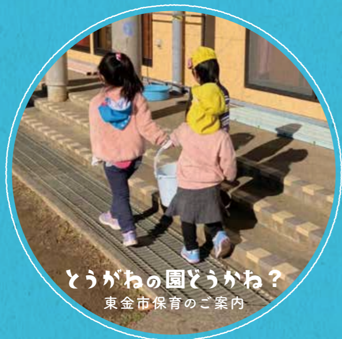
とうがねの園どうかね？ 東金市保育のご案内