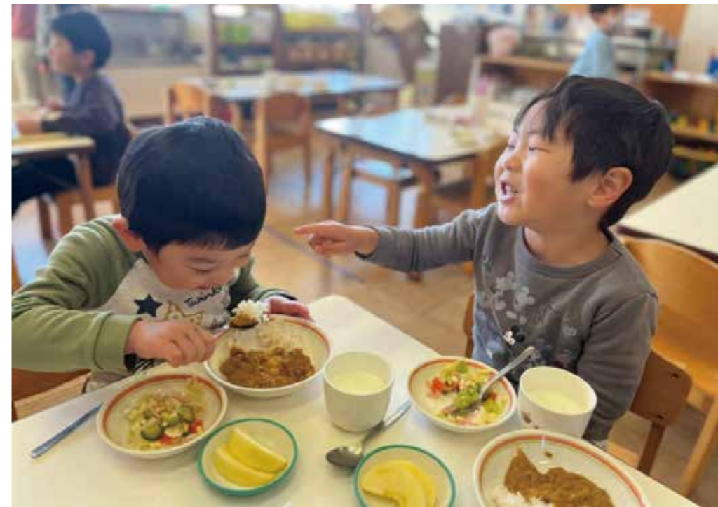
よく遊び、よく食べて、成長します