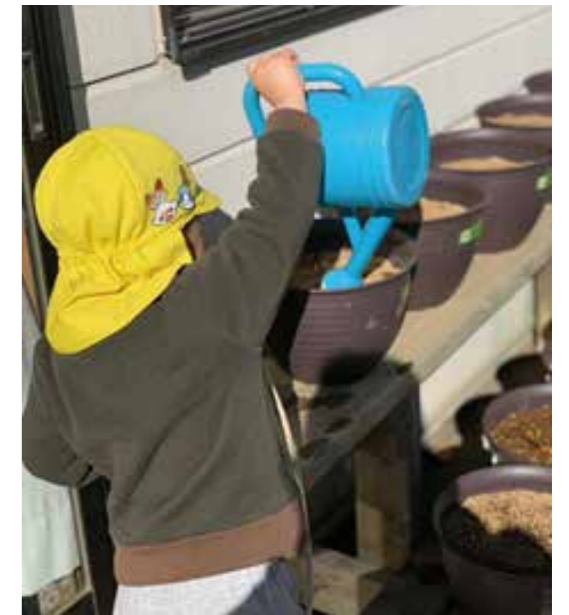
毎日植物に水をやり、育てます