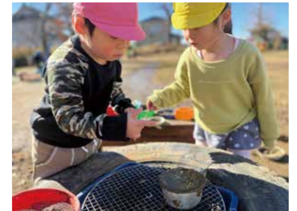
異年齢の関わりの中で、学び育ちます