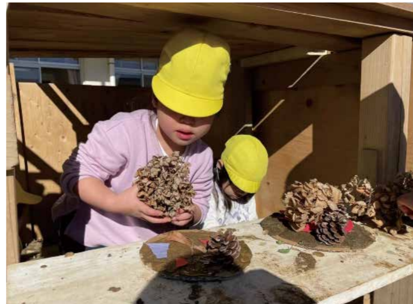
自然物でピザ屋さん