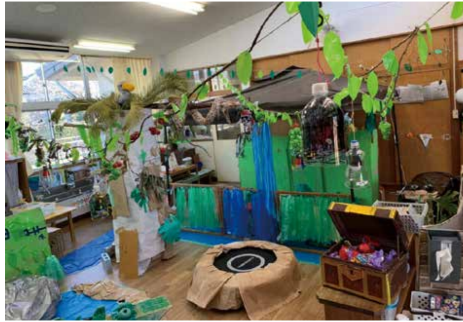
保育室がジャングルに

東金の園では、「子どもの主体性」を大切にされた保育を行っています。主体性は、自分で選ぶこと、自分で考えること、そして、自分で決めること、自分で解決すること、子どもたちは遊びの中から、学んでいます。