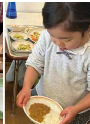
自分で用意して自分で片づけます。生活の中からも学びます。

※現在は、コロナウイルス感染症予防のため、パーティションの設置や配膳の配慮等を行っています。