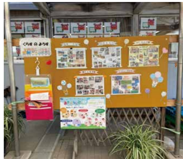
保育の様子の掲示