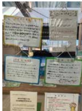
各クラスのドキュメンテーション

日々の保育の様子をボードで伝えます。また、保育や子どもの様子を写真に撮って記録し、“ドキュメンテーション”という方法でまとめ、保護者に伝えたり、保育の振り返りをしたりしています。