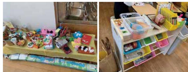
自由によって自由に表現できるように、いろいろな素材が自由に使えるようにしています