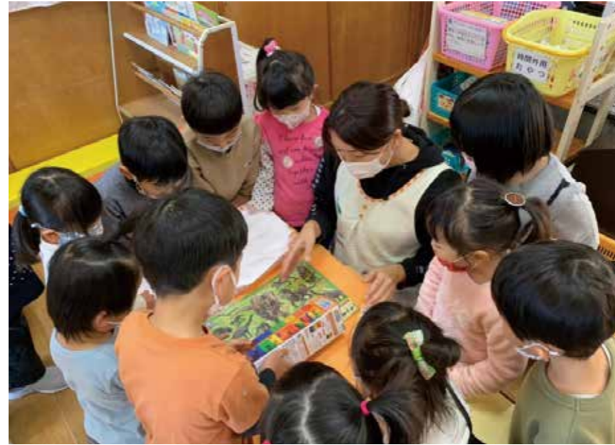
「興味津々」これから何が始まるのか？