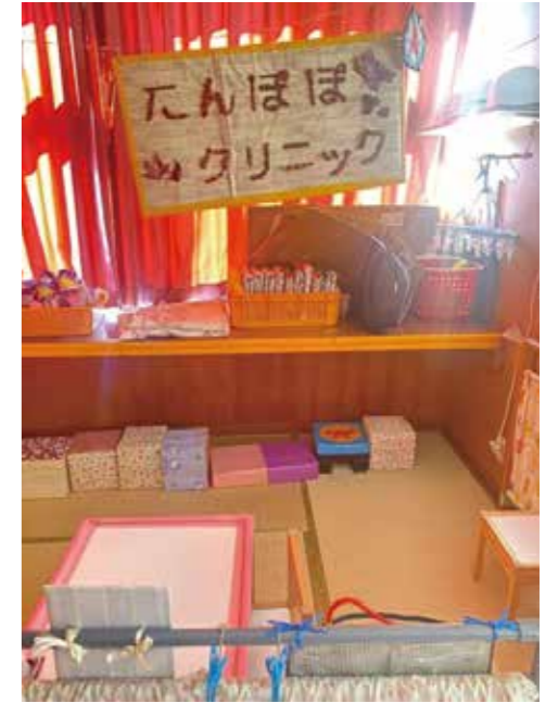
病院ごっこも本格的