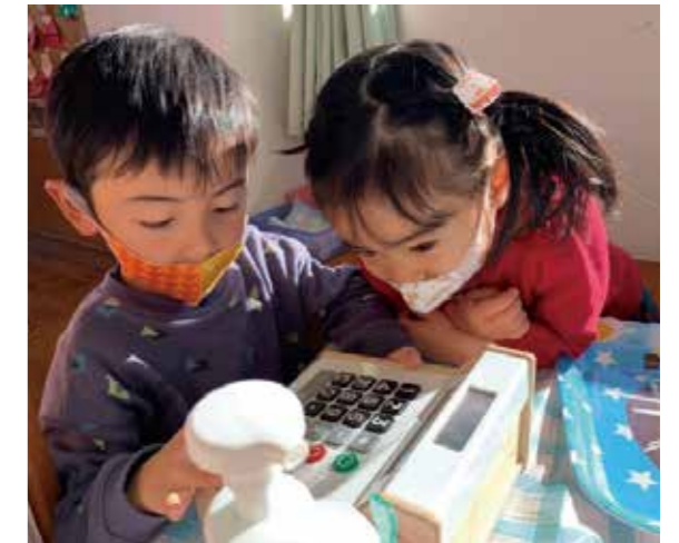
「いくらですか？」遊びの中で、数ややりとりも学びます