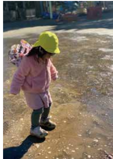
水たまりを踏みしめる

自然豊かな東金市。園では、周囲の自然や園内の自然を保育に生かしています。 “センスオブワンダー”（自然の不思議さに心躍らせる体験）な活動を大切にしています。