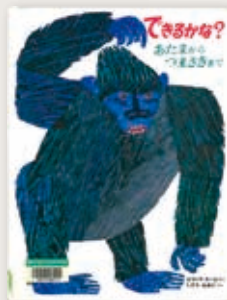
「できるかな? あたまからつまさきまで」