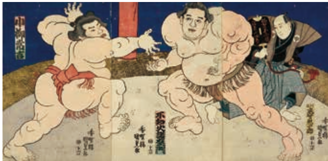
歌川国貞〈不知火諾右工門・小柳常吉〉大判錦絵3枚続、天保11～13年(1840～42)