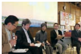
ふるさとmini 動画大賞（2016年）