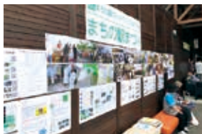
道の駅でまちの駅まつり（2019年）