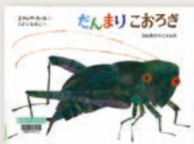
「だんまりこおろぎ」