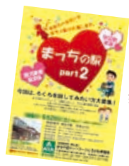
婚活パーティーイベント「第1回 まっちの駅」（2013年）

うという組織であり、行政もかわっているのに行政主導ではないところが画期的だといえます。 『駅長会議』の形式は『円卓会議（マルチステークスホルダー・プロセス）』と言われ、利害の食い違つ者や社会的立場や規模の異なる主体どうしでも、お互いを理解し関係を深めながら多様な意見を反映させて合意形成、意思決定していくというスタイルを理想としています。 『まちの駅ネットワークとうがね』は、立ち上げ時には東金商工会議所の重要施策に盛り込まれ、千葉県「連携・協働による地域課題解決モデル事業（新しい公共）」として認定され、県のサポートを受けながら組織として成長していきましました。東金市の市民提案型協働事業にもしばしば選ばれ