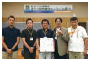
まちの駅全国大会 in とやま（2015年）