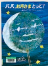
「パパ、お月さまとって!」