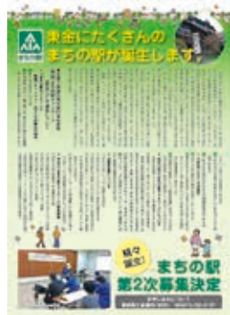
2012年、設立当時の募集チラシ