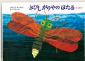
「さびしがりやのほたる」