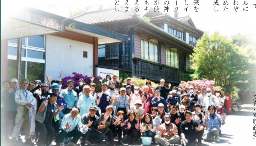
※写真撮影時のみマスクを外しています

トークショー「八鶴館の未来を考える」は、現在YouTubeにてアーカイブがご覧になれます。上記のQRコードからどうぞ