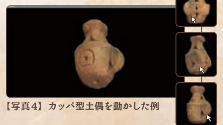
【写真4】 カッパ型土偶を動かした例

生涯学習課では、東金市の文化財を身近に感じてもらうため、インターネット上に歴史館をつくる事業として、平成30年度より「東金市デジタル歴史館」事業を進めてきました。