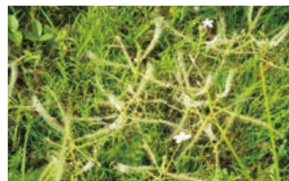
ナガバノイシモチソウ