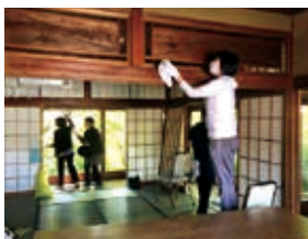
88名もの有志によって大そうじが行われました