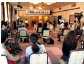
トークショーの様子はオンラインでも配信

付けられた有志らは、こんどの『新生 八鶴亭』にはレストラン経営に専念してもらって、レストランと直接関係のない建物は「八鶴館を守る会」が管理し、貸し部屋を運営して補修・営繕の資金を捻出する仕組みを提案しました。