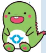
東金市マスコットキャラクター「とっちー」