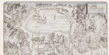
【写真3】 より拡大した「東金町鳥瞰図」