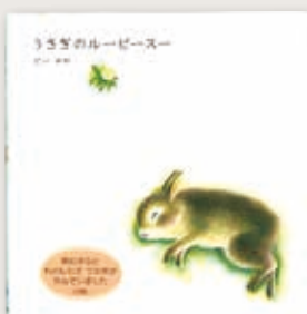
「うさぎのルーピースー」 小学館