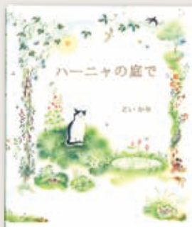
「ハーニヤの庭で」 偕成社