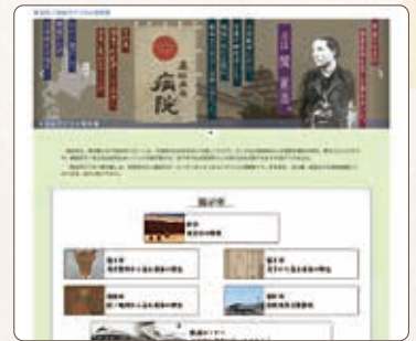
【写真1】 トップページの様子