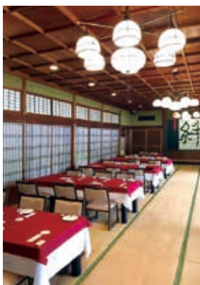
フレンチレストランとして生まれ変わった、「レイクサイドレストラン八鶴亭」