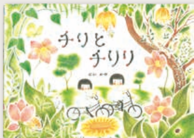
「チリとチリリ」 「チリとチリリ あめのひのおはなし」 アリス館

もう一冊お勧めなのは『ハーニヤの庭で』です。ねこのハーニヤは山のとちゅうのちいさな家にすんでいます。そこにはちいさな庭があって、ちいさな畑とちいさな池があり、実のなる木が何本かはえていて、かぞえきれないほどのちいさな生きものたちもすんでいます。うさぎやわたり鳥や鹿などのおきゃくさんもやってきます。しずかな庭ですが、そこでは毎日いろいろなことがおこっているのです。そのハーニヤの庭での一年間が、ゆつたりと描かれていきます。ほっこりとしたあ