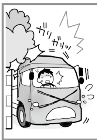
張り出した樹木や枝が道路に覆いかぶさり、通行の妨げになっている。