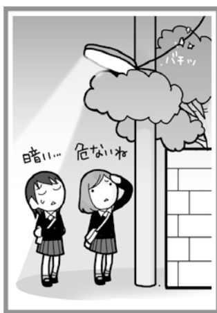
張り出した枝葉が防犯灯の光を遮ってしまい、道路が暗くて危ない。