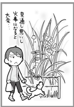
雑草などが繁茂して見通しが悪く、衛生面にも悪影響がある。