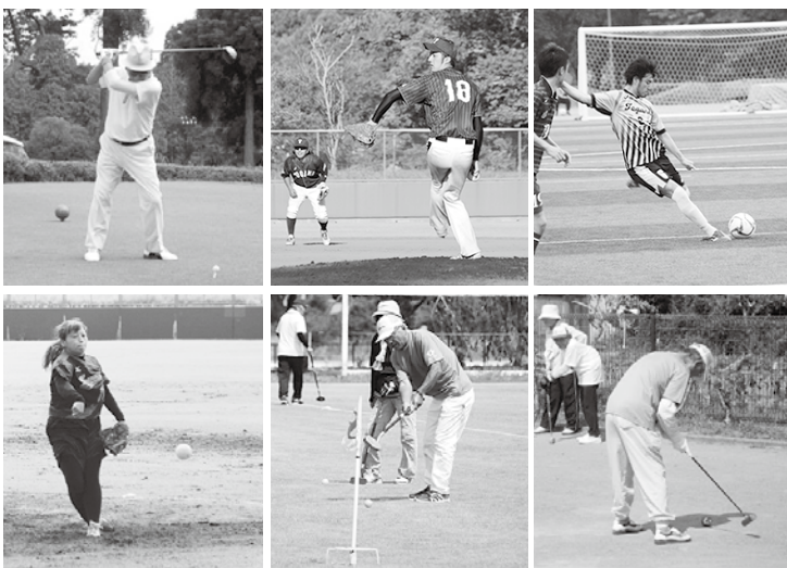
7月中までに行われた競技の様子

7月15日(全19種目)の中で4番目に行われた「ゲートボールの部」では、最高気温32℃という中にも関わらずベテラン選手たちのプレーが冴え渡り、東金市選手団の先陣を切って、見事に優勝しました！