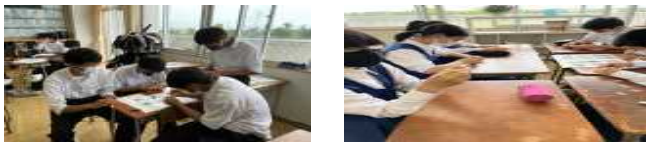
〔各教室にて縦割りによる話し合いとシトラスリボン作製の様子〕