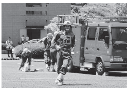
競技の様子(ポンプ車の部)