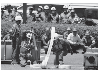
競技の様子(小型ポンプの部)