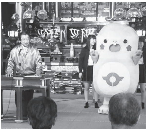
元気いっぱいのとっちー